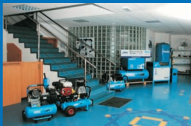
Ogledno - prodajni prostor